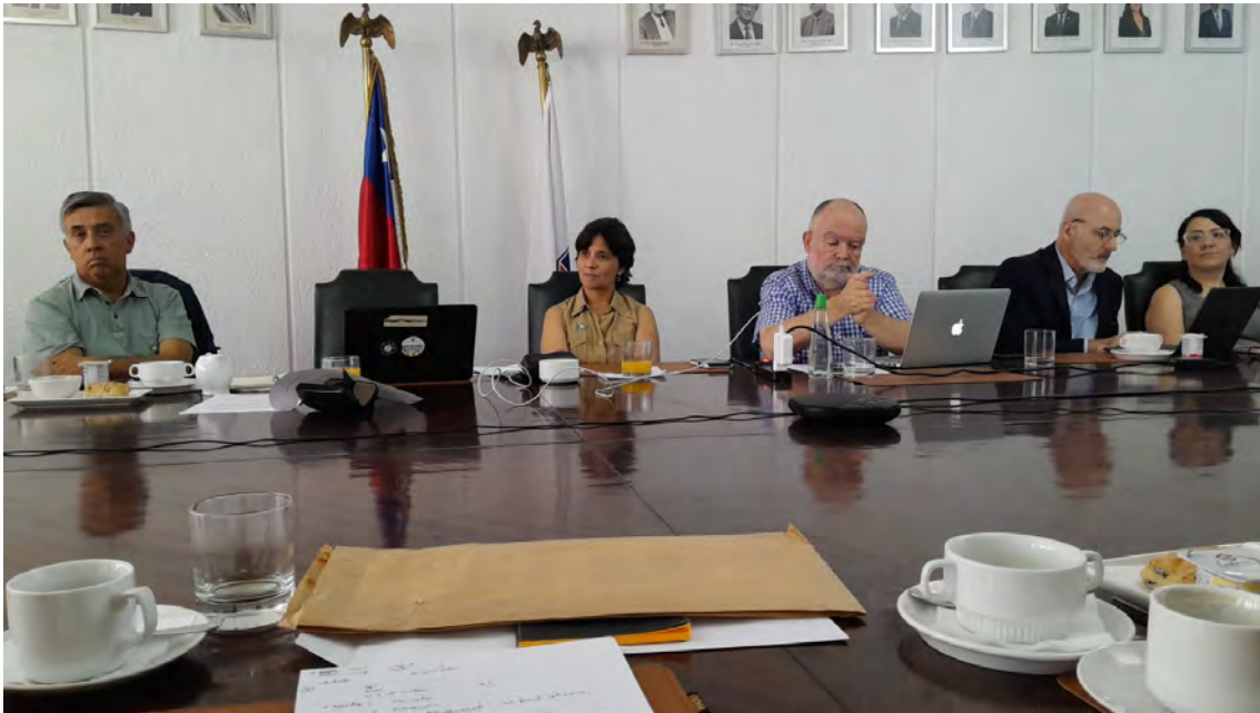
Asistentes de la reunión con pin Departamento en su solapa