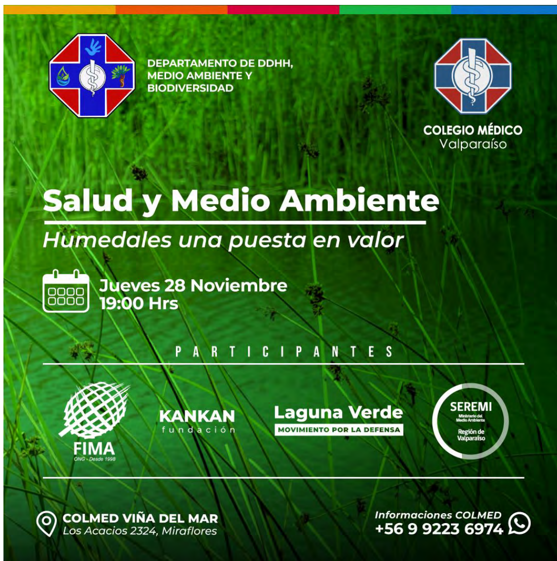
Afiche de charla humedales