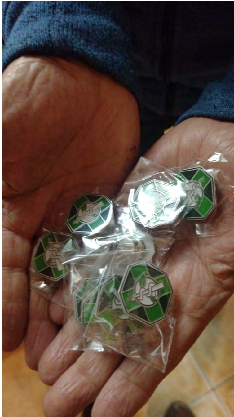
Los pines del Departamento entregados a los asistentes del 11 de enero