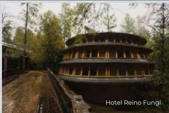
Hotel Reino Fungí