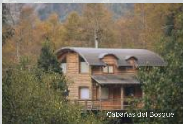
Cabañas del Bosque