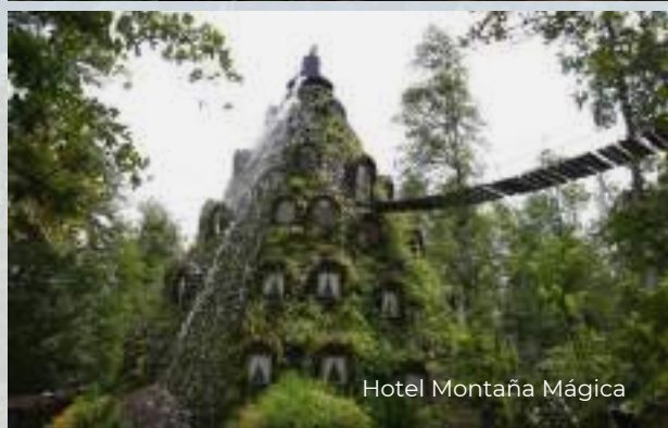
Hotel Montaña Mágica