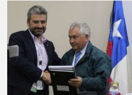
Entrega Formal de Directorio Transitorio, 2016 en asamblea Arica