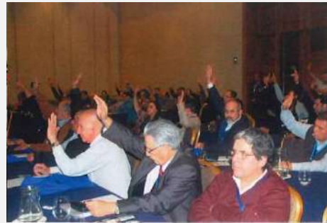
Asamblea Valdivia, 2013