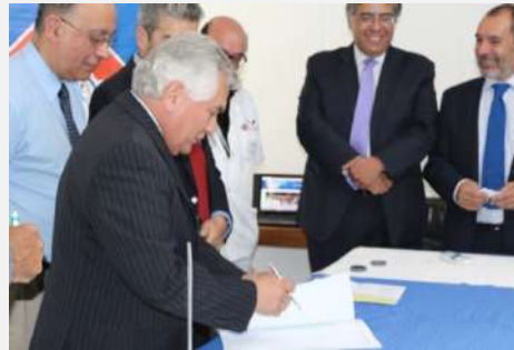
Firma Acta Constitutiva, 2015