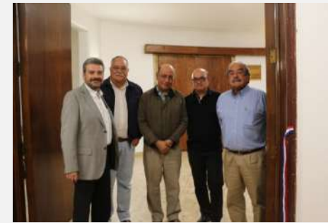
Directorio Transitorio, 2015